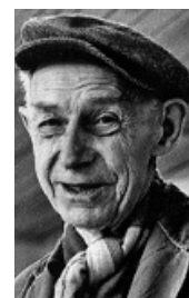
PRIMUS MORTIMER PETTERSSON 1895–1975.

AKVARELL av Primus Pettersson. Fotspår före- kommer ofta, liksom starka perspektivför- skjutningar.